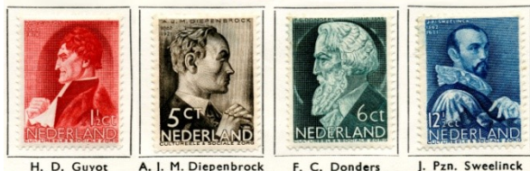
H. D. Guyot A. J. M. Diepenbrock F. C. Donders J. Pzn. Sweelinck